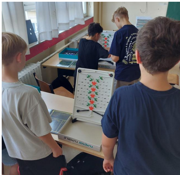
Abbildung 2: Schüler beim Rätseln